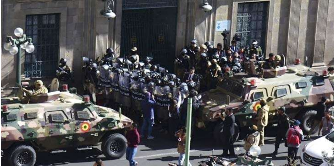
27 de junio de 2024